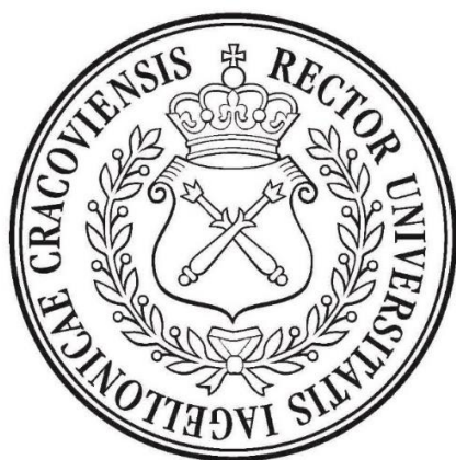
Pieczęć mniejsza Uniwersytetu Jagiellońskiego (średnica 45 mm)