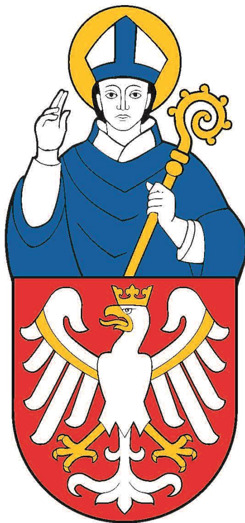
Wzór tradycyjnego herbu Uniwersytetu Jagiellońskiego