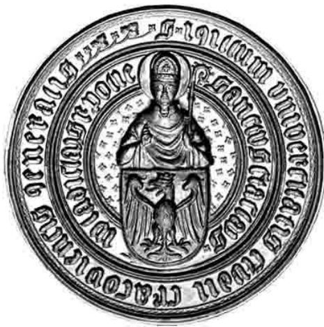
Pieczęć wielka Uniwersytetu Jagiellońskiego (średnica 65 mm)