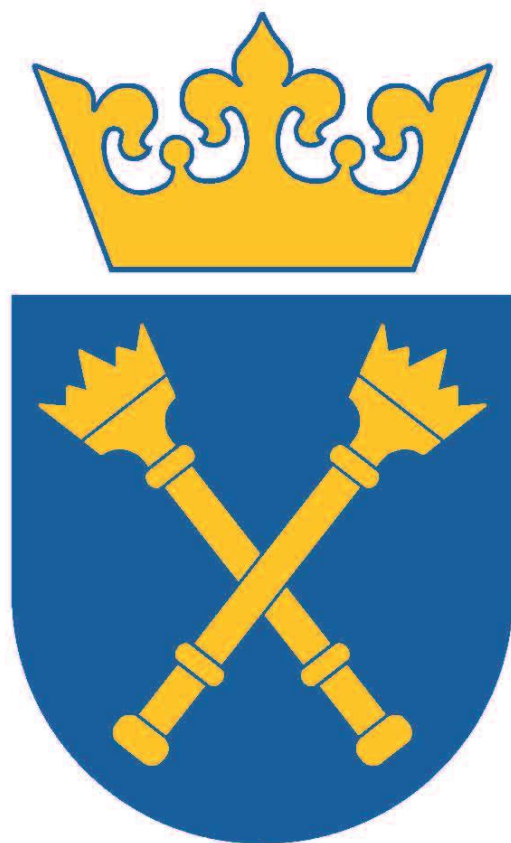
Wzór herbu Uniwersytetu Jagiellońskiego