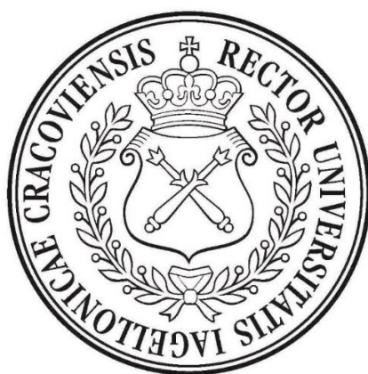
Pieczęć mniejsza Uniwersytetu Jagiellońskiego (średnica 45 mm)