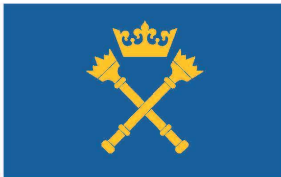
Wzór flagi Uniwersytetu Jagiellońskiego